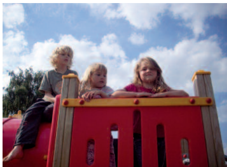
Zufriedene Kinder aus Brandenburg

sowie alle Kinder, Anwohner und die Jugendbetreuerinnen zur offiziellen Einweihung des Spielplatzes.